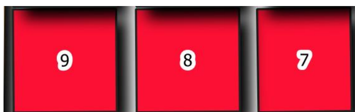
Obr. 1 - Ukázka zakreslení obsazených hrobových míst na mapě hřbitova

Grafickou část pasportu představují fotografie hrobů a přehledná mapa hřbitova s vyznačením všech hrobových míst a doplňujících prvků hřbitova. Atributy k výstupnímu mapovému listu se nachází v přílohových evidenčních tabulkách. Zakreslení hrobových míst bylo provedeno na podkladové vrstvě ortofotomapy a za pomoci katastrální mapy ve formě pravouhelníků s číslem hrobu uprostřed, viz Obr.1 pro obsazená hrobová místa, popř. Obr.2 pro volná hrobová místa.