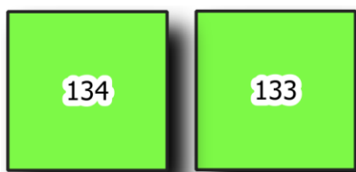
Obr. 2 - Ukázka zakreslení volných hrobových míst na mapě hřbitova